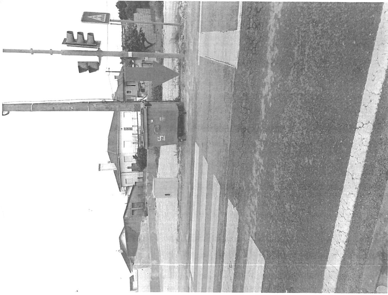
RUA PADRE JOAQUIM GONÇALVES MARGALHÃES, FRENTE À IGREJA - BARREIROS - AMOR