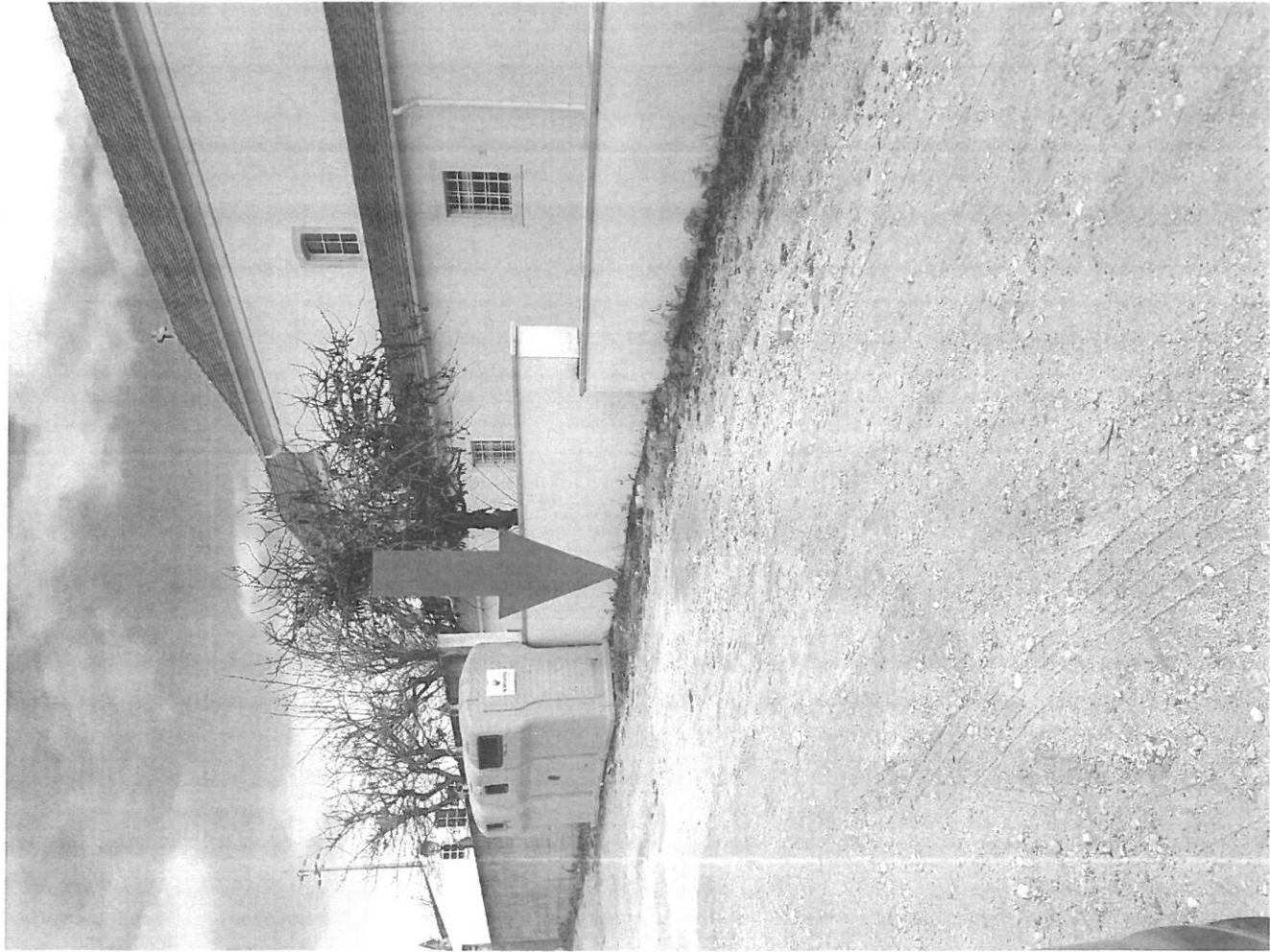
RUA DA BASE AEREA - JUNTO A IGREJA AMOR