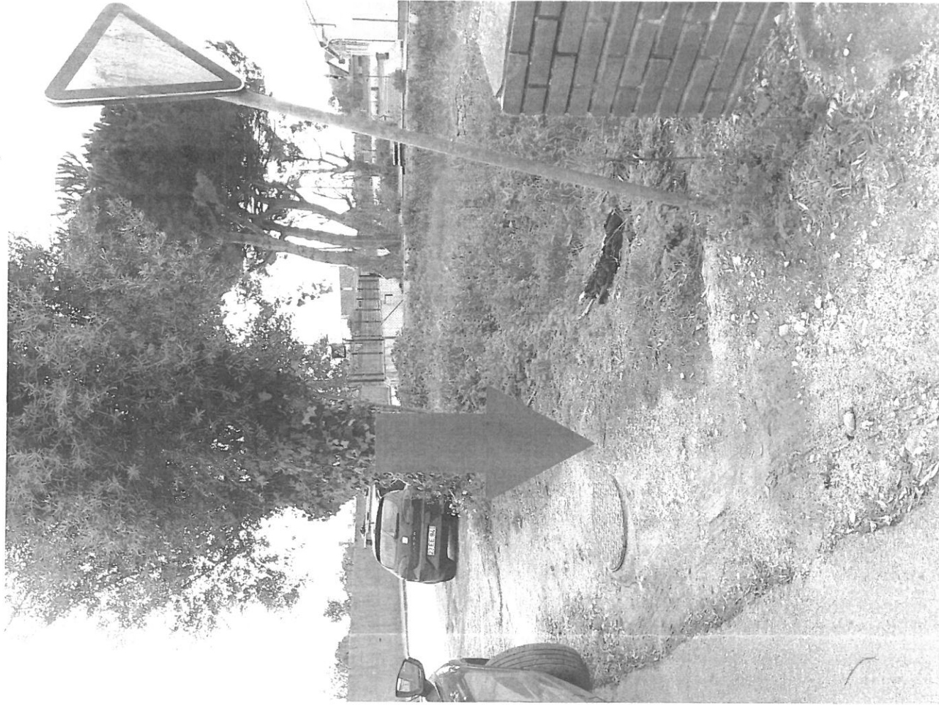
RUA CENTRAL - COVECINHEIRA JUNTO INTERMUNICÍPIO AMOR